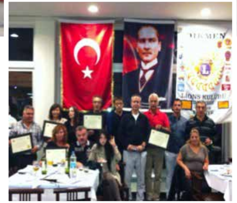
Alanya Kastalia Otel