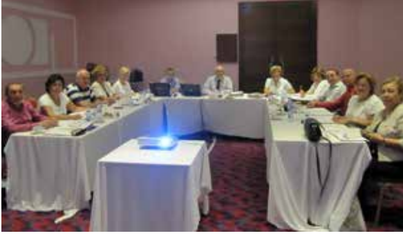
Konsey Başkan Yardımcımız ve Genel Yönetmen Yardımcılarımızın toplantısı