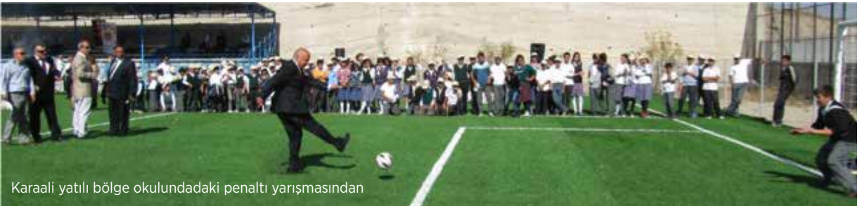
Karaali yatılı bölge okulundaki penaltı yarışmasından