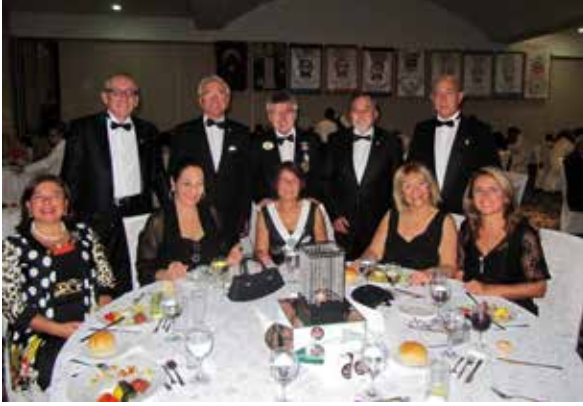
Genel Yönetmenlerimiz eşleri ile..