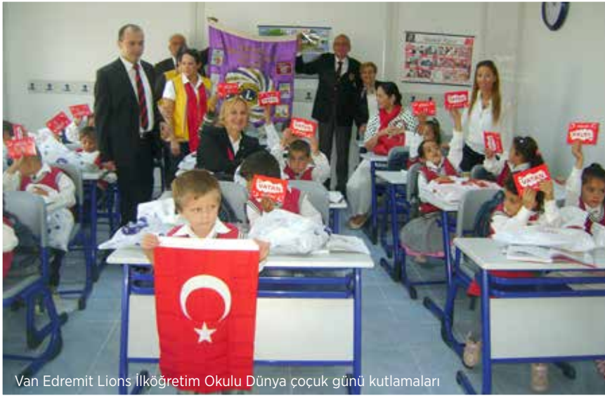
Van Edremit Lions ilköğretim Okulu Dünya çocuk günü kutlamaları

Sevgili Lion kardeşlerim, bu gurur hepimizin.