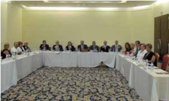
Konsey Başkanımızın Başkanlığında Genel Yönetmenlerimiz, Genel yönetmen Yardımcılarımız ve Ulusal Komsiyon Başkanlarımızın toplantısı

onurlandırdı. Eskişehir de yapılan çalışmalar ve Lions hakkında yapmış olduğu konuşmadan sonra salondan ayrılarak toplantımızı sürdürdük. Verimli geçen Konsey toplantımıza katkı sağlayan, bilgi paylaşımında bulunan destek veren herkese şükranlarımızla.