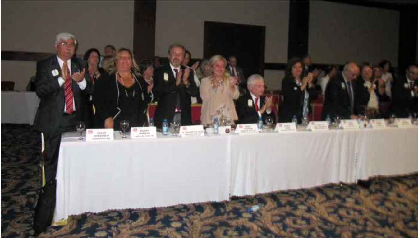
Geçen Dönem Genel Yönetmenleri bir arada