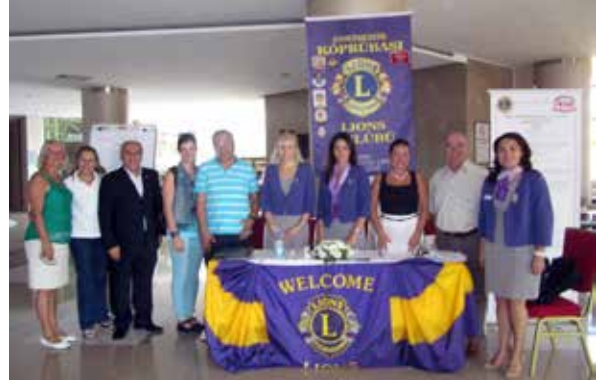
Konsey toplantısının evsahipliğini yapan 118-K Yönetim Çevresinden Eskişehir Köprübaşı Lions Kulübüne göstermiş oldukları ev sahipliği için teşekkürlerimizle...