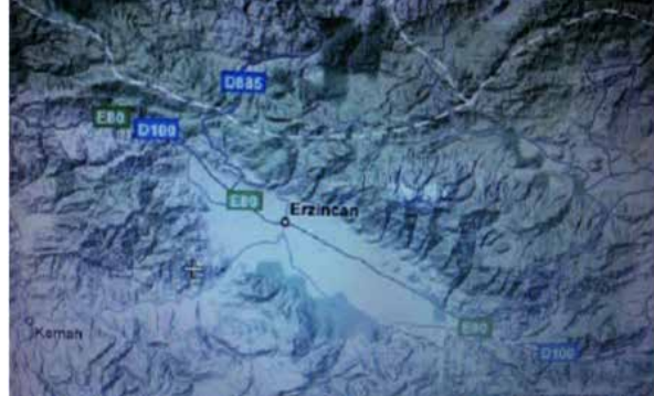
Resim 1- Erzincan kenti haritanın ortasında görünen ovadan bin yıl boyunca, sürekli yıkımlara karşın, tehlikeli deprem alanından 10-15 Km. dahi kaymamıştır, ovadan ayrılamamışlardır.

Yalnız ülkemizde değil Dünya'da da aynı örnekleri görüyoruz. ABD 'de San Fransisco, Meksika'da başkent Meksiko City, Akdeniz'de Rodos, Mikonos v.d. adaları, Uzak Doğu'da Tokyo, ve Polinezya ada yerleşmeleri birkaç örnek. Bu ve benzeri örneklerdeki kayıpların nedenleri araştırıldığında karşımıza insan ve bilginin kullanımı sorununun çıktığını görebiliriz. MAL VE İNSAN KAYIPLARININ NEDENİ YİNE İNSAN HATASIDIR. DEPREM ÖLDÜRMEZ HATALI YAPI ÖLDÜRÜR. Afetler elbetteki depremden ibaret değildir ve aynı zamanda insan eliyle de yaratılmaktadır. Bu nedenle sınıflandırma yeniden ele alınmıştır (Tablo 2).