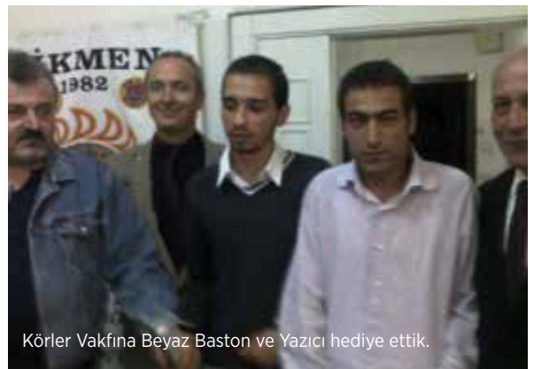
Körler Vakfına Beyaz Baston ve Yazıcı hediye ettik.