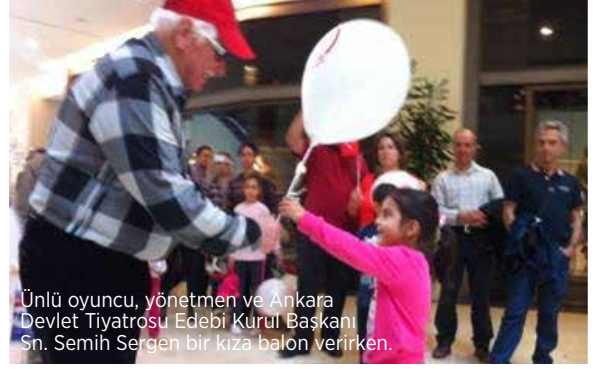
Ünlü oyuncu, yönetmen ve Ankara Devlet Tiyatrosu Edebi Kurul Başkanı Sn. Semih Sergen bir kıza balon verirken.

Cumhuriyet tarihimizin önemli iki şehrinde eşzamanlı olarak gerçekleştirilen “29 Ekim Cumhuriyet Balonları” aktivitesi Cumhuriyet Bayramımızın önemini birkez daha vurgulayarak unutulmamasını sağlamıştır.