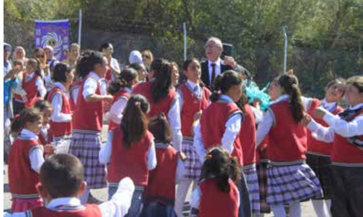
Van Edremit Lions İlköğretim Okulu Dünya çocuk günü kutlamaları

"Sevgiyle Elele Verip, İyilikleri Paylaşalım" sloganının bu ortamı anlatabilmek için hazırlandığını bile