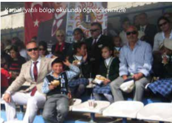
Karaali yatılı bölge okulunda öğrencilerimizle