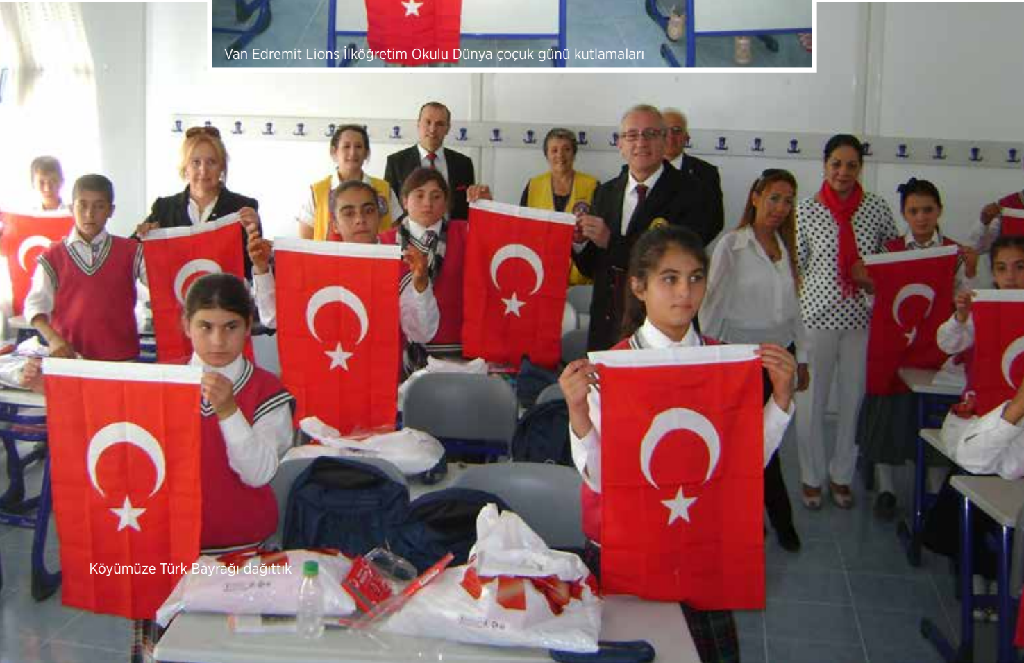
Köyümüze Türk Bayrağı dağıttık